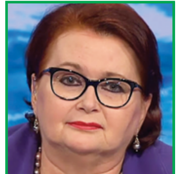
Ministrica dr. Bisera Turković