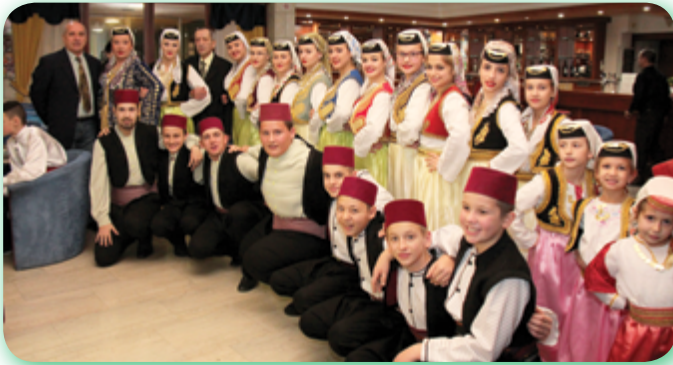
FOTO IZVJEŠTAJ SA SMOTRI FOLKLORA I KULTURNOG STVARALAŠTVA BOŠNJAKA RH